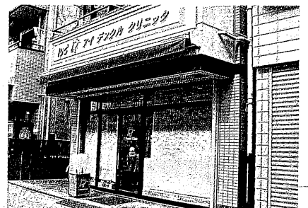
道路沿いのこの歯が目印です